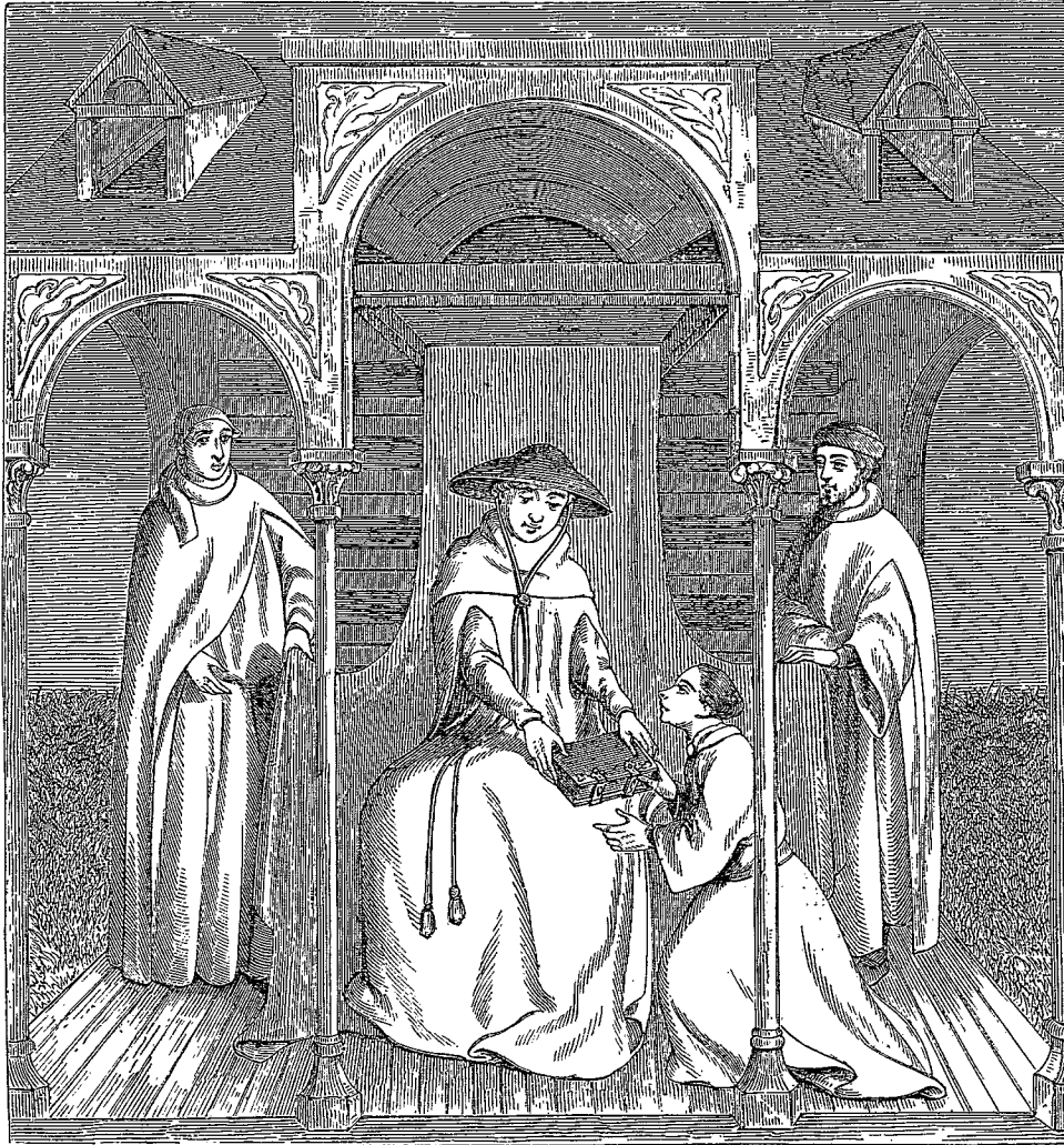
Le cardinal Talleyrand de Périgord recevant l'hommage d'un manuscrit. — D'après une miniature du Livre des Merveilles .

qu'à lui d'être pape après la mort d'Innocent VI : il préféra faire élire Urbain V. Peut-être serait-il parti pour une croisade comme légat ; mais il mourut le 17 janvier 1364. Il laissa une fortune immense. On a remarqué dans son testament une clause singulière par laquelle il léguait à son neveu, alors chevalier en Guienne, « toute la quantité de poivre qu'il avait à Montpellier. » On regarde comme certain qu'il s'était, en grande partie, enrichi